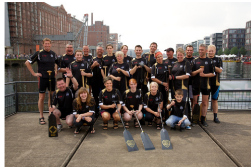
Innenhafen, 26. Juni 2011

Die Breitensportklasse ist in Deutschland die zweithöchste Rennklasse. Sie berechtigt das Team sowohl bei den deutschen Meisterschaften als auch bei den Landesmeisterschaften von NRW teilzunehmen. Die deutsche Meisterschaft, die dieses Jahr in Brandenburg ausgetragen wurde, musste es dieses Jahr noch nicht sein, aber die Teilnahme an der Landesmeisterschaft NRW ließen sich die LeBau Fighters nicht nehmen.